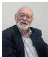
元国土交通省自転車活用推進本部有識者委員 株式会社RMJホールディングス 顧問

「個人的には免許制導入には反対です。自転車は便利で環境に優し いだけでなく、行動範囲を広げ、地域とのふれあいや仲間とのつな がりを取り持つコミュニケーションツールです。運転免許という形では なく、皆が正しいルールを勉強し、そのルールをきちんと守り、皆で シェアする公共空間を安全かつ効率的に利用することを目指してい くべきだと思います。ただし、どれほど注意をしても、自転車事 故をゼロにすることは困難です。不幸にも事故が起きたとき、被害者 側への生命や身体、財産等の損害の補償はもちろん、加害者側の財 産的、精神的な負担を軽減するためのシステムとして、保険制度が 存在します。自転車保険は共済、助け合いの制度なのです。自転車を 楽しく有効に活用するためにも、自転車保険という保証を必ず携え てほしいと思います」。