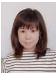
日本アイラック株式会社 カスタマーリレーション事業部

今回ご紹介した4つの対策に共通するのは、「その場ですぐに要求を受け入れないこと」です。たとえ企業側のミスが明確だとしても、まずはクレーム内容を丁寧にヒアリングし、企業が主体となって調査を実施。そのうえで企業として誠心の謝罪と、適切な対応を行う姿勢を徹底することが重要です。そのためには、現場レベルで悪質クレームかどうかを判断できる教育や体制も不可欠です。企業としての対応方針を明確にし、社内全体で共有して適切な対応を実現しましょう。