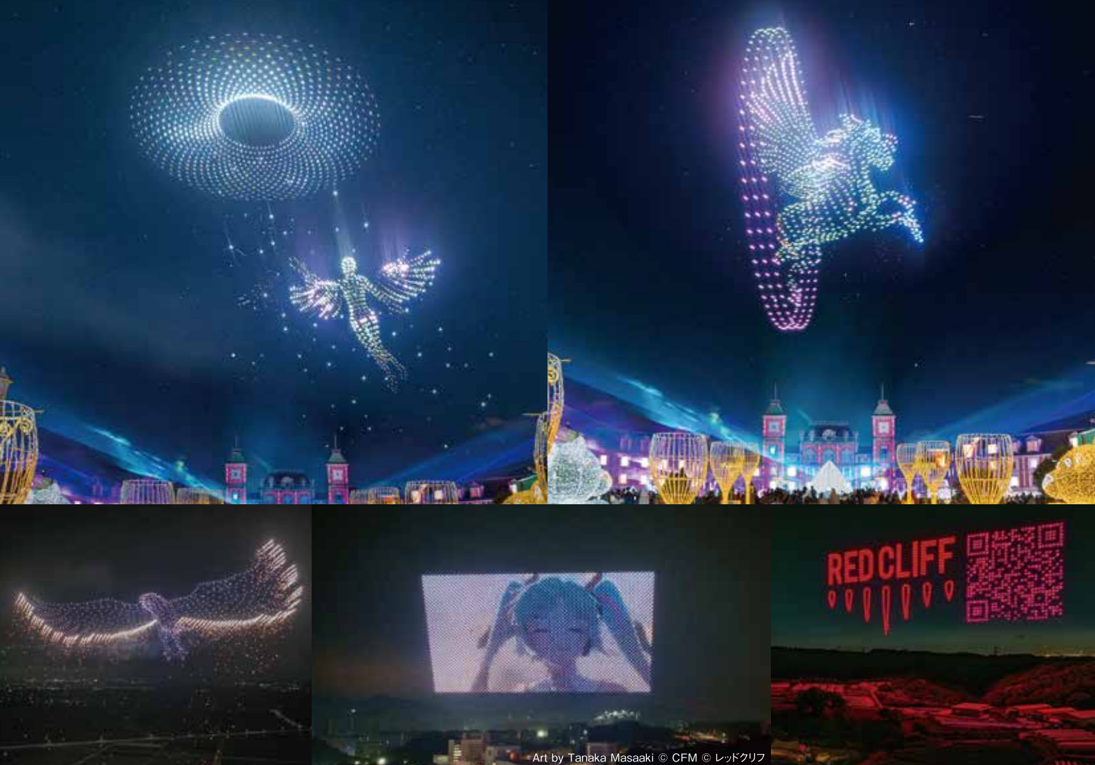
Art by Tanaka Masaaki © CFM © レッドクリフ