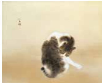
竹内栖鳳《班猫》(重要文化財)