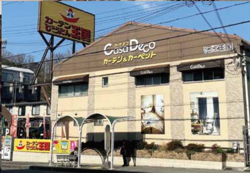
1986年 じゅうたん王国1号店