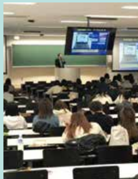
大学での学生向けセミナー

このようにCS事業部では、クライアント様の立場に立って365日24時間体制でスムーズな事故処理対応やトラブルの解決する、という他ではあまり見かけないニッチなサービスを提供しています。様々な「危機」に対応するためには経験と知識が重要となり、長年蓄積した経験と知識が他社には簡単に真似できない当社のサービスとなっております。