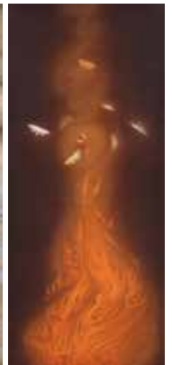
速水御舟《炎舞》 (重要文化財)