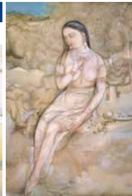
村上華岳《裸婦図》 (重要文化財)