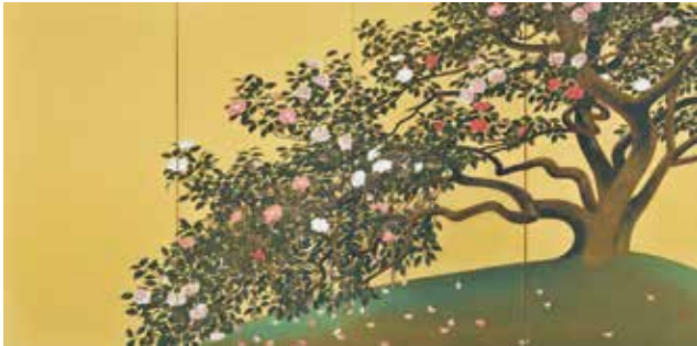
速水御舟《名樹散椿》(重要文化財)