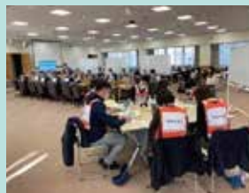
大学での模擬訓練の様子

ただ、海外向けのサービスが多いため、海外渡航が止まったコロナの時期には約3年半にわたり仕事が激減しましたが、社内での助けを借り、何とかコロナ禍を乗り切ることができました。2023年度からはようやく海外渡航もコロナ前の状況に戻り、危機管理セミナーや重大事故発生を想定した模擬訓練(シミュレーション)の依頼も増え、クライアント様の「危機」をサポートできる日々に戻ってまいりました。